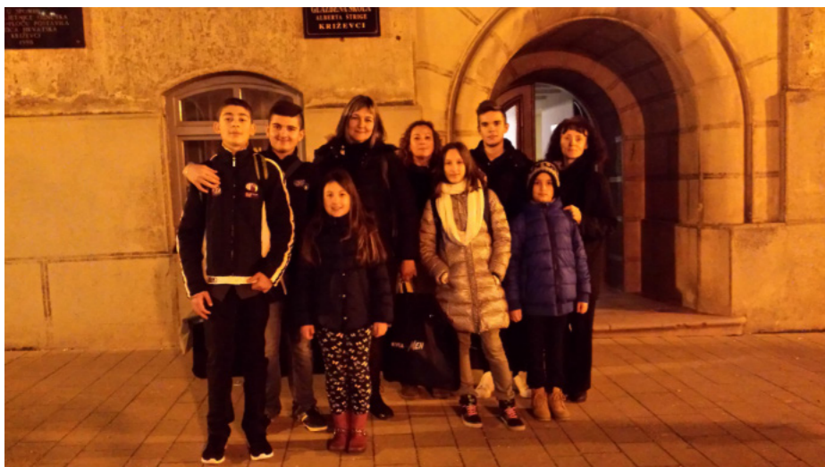
Mladi harmonikaši i klaviristi s nastavnicama nakon natjecanja u Križevcima

U organizaciji Glazbene udruge Opus i Glazbene škole Alberta Štrige, u Križevcima je od 4. do 7. veljače 2016. godine održano drugo po redu Natjecanje mladih glazbenika Sonus op. 2 . Natjecanje je održano u pet disciplina - solfeggio, klavir, harmonika, violina i udaraljke, za učenike osnovnih i srednjih glazbenih škola. Sudjelovale su mnoge škole iz sjeverne, središnje i istočne Hrvatske, a u pojedinim je disciplinama (prva kategorija violine te prva i druga kategorija udaraljki) natjecanje dobilo i međunarodni karakter (Srbija i Slovenija).