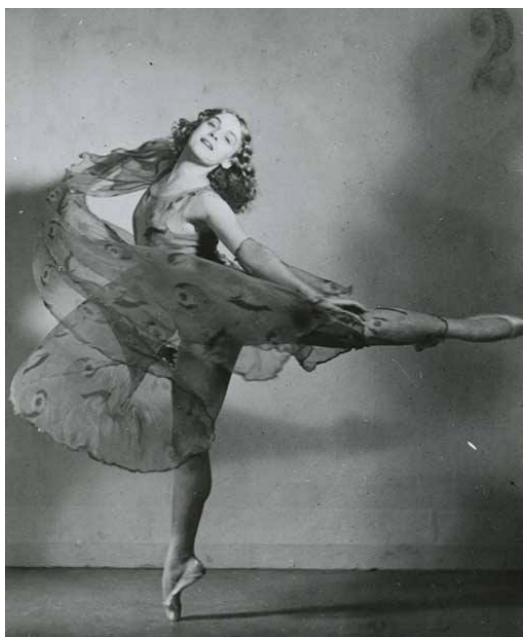
Mia Čorak kao sedamnaestogodišnja djevojka

Ljepota, Gracija i Harmonija, kako je prozvana u francuskom tisku 1938. godine, Mia Čorak Slavenska otisnula se iz Broda na Savi k Zagrebu, Europi i naposljetku čitavom svijetu, postavši prva hrvatska primabalerina i jedna od najistaknutijih baletnih umjetnica svijeta. U 2016. godini trinaesto izdanje Dana plesa , koji će biti održani od 20. do 27. veljače, u znak je 100 godina od umjetničina rođenja. A kada je Mia imala 16 godina o njoj je tisak već pisao hvalospjeve: