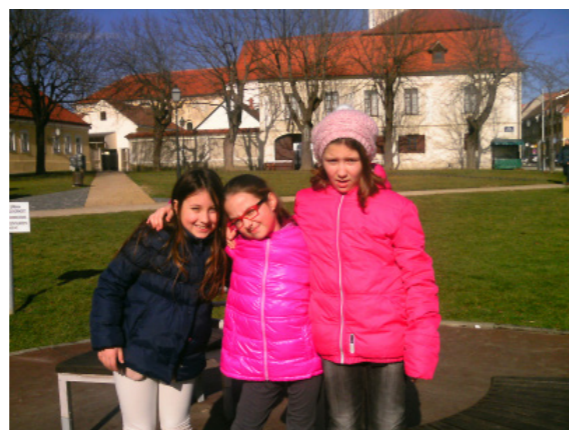
Solfedistice su osvojile sve tri nagrade