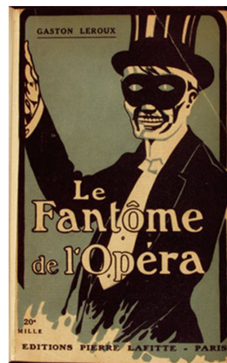
Izdanje Lerouxove novele iz 1920. godine