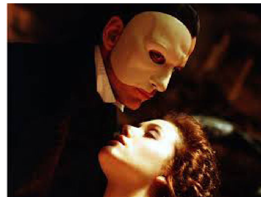
Prizor iz filmske adaptacije Fantoma u operi redatelja Joela Schumachera iz 2004. godine: Film je bio nominiran za tri nagrade Oscar , ali nijednu nije osvojio