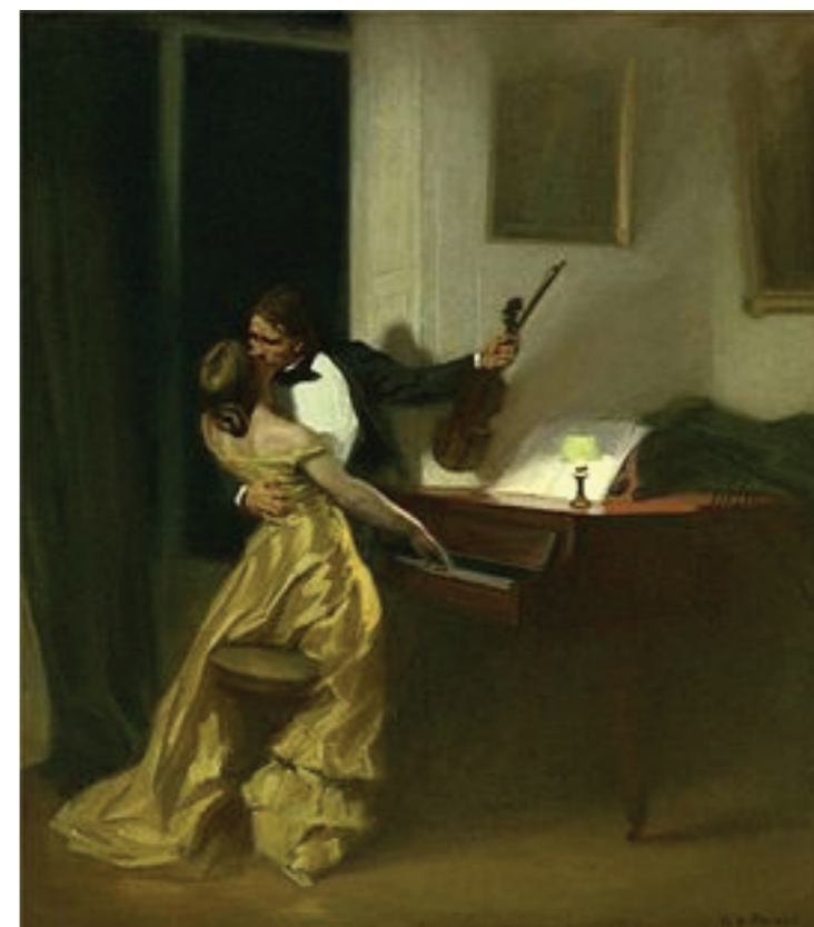
Kreutzerova sonata , slika Renéa Françoisia Xaviera Prineta iz 1901. počiva na ideji istoimene Tolstojeve pripovijetke

prolazilo njihova je ujedinjenost u zajedničkom stvaranju umjetnosti rasla, a dosegla je vrhunac u posebno strastvenoj Kreutzerovoj sonati .